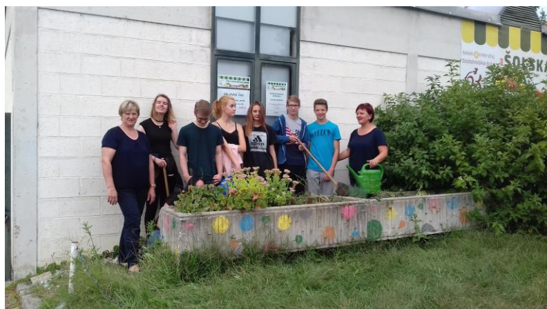
Slika 2: Dijaki so poskrbeli tudi za trajnice v koritih ob parkirišču

Okoljevarstveni tehniki pri strokovnih predmetih s področja okoljevarstva v šoli pridobivajo veliko znanja o varovanju okolja in ohranjanju čistega življenjskega prostora, zato se še posebej zavedajo pomena ozaveščanja prebivalcev v takšnih čistilnih akcijah