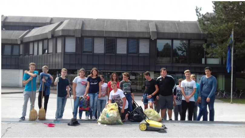
Slika 1: Dijaki Biotehniške šole pri čiščenju okolice šole

V akcijo so se vključili dijaki programa okoljevarstveni tehnik, ki ga izvaja Biotehniška šola.