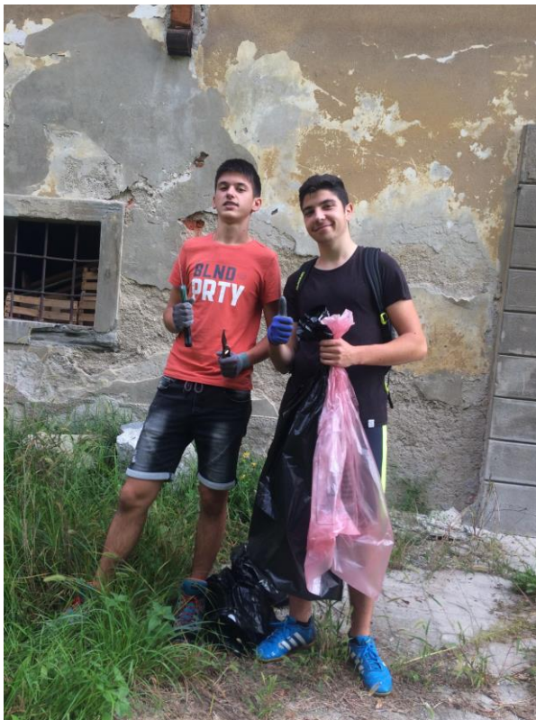
Slika 5: Okoljevarstveni tehniki pri urejanju učne poti v turniškem parku