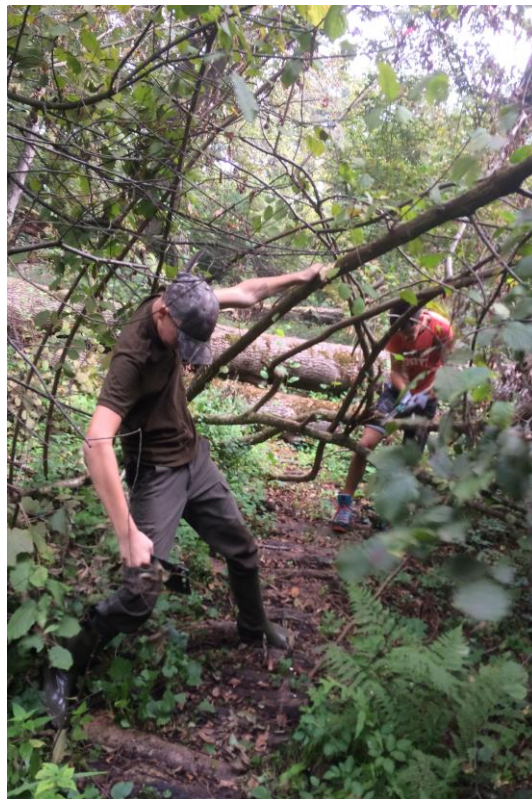
Slika 6: Okoljevarstveni tehniki pri urejanju učne poti v turniškem parku