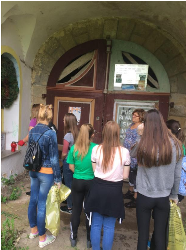
Slika 3: Okoljevarstveni tehniki s profesorico čistijo okolico turniškega gradu